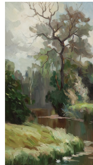
Sonderausstellung 2013 100 Jahre Alexej von Assaulenko